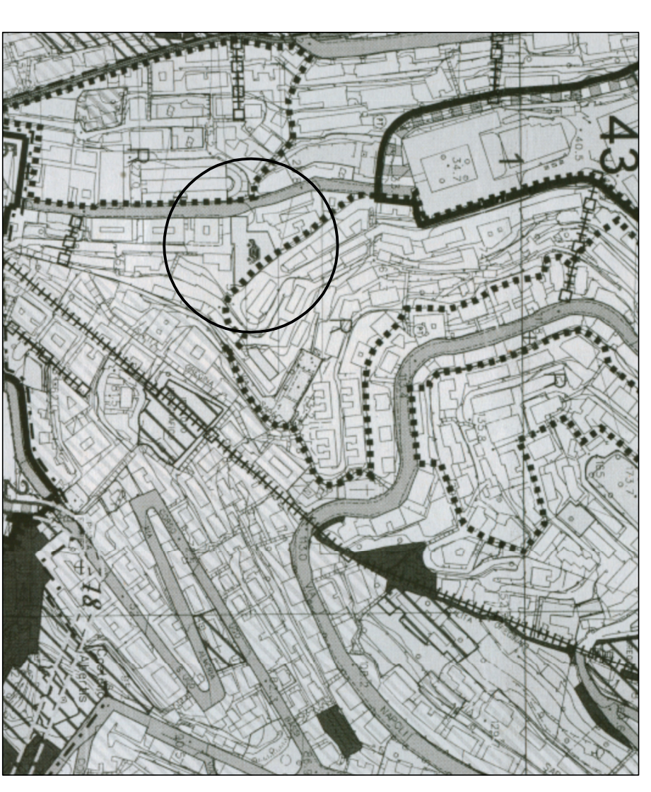
STRALIOIO P.U.C. TAV. N° 38 scala 1:3000